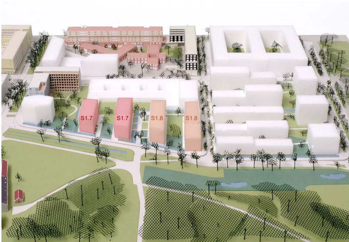
Vue du lot sur le secteur sud de la ZAC de l'école polytechnique, Photo de maquette du secteur · Echelle 1:750 List OKRA