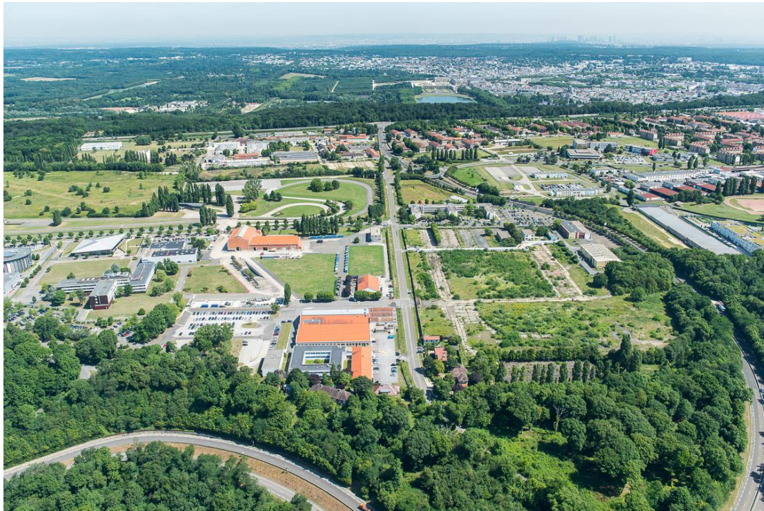
Le futur quartier Lisière, à proximité de la forêt, au sein de la ZAC Satory Ouest

Le projet de la ZAC Satory Ouest est principalement fondé sur deux idées directrices :