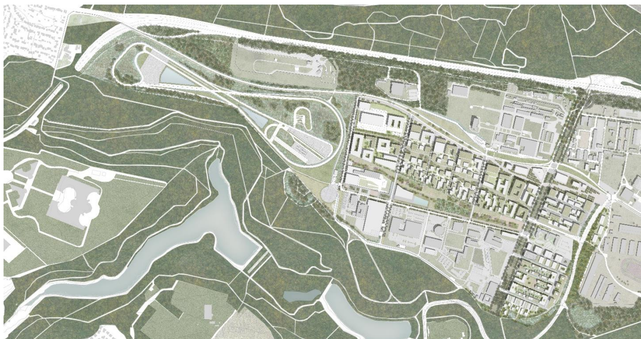
Le quartier Satory Ouest à terme