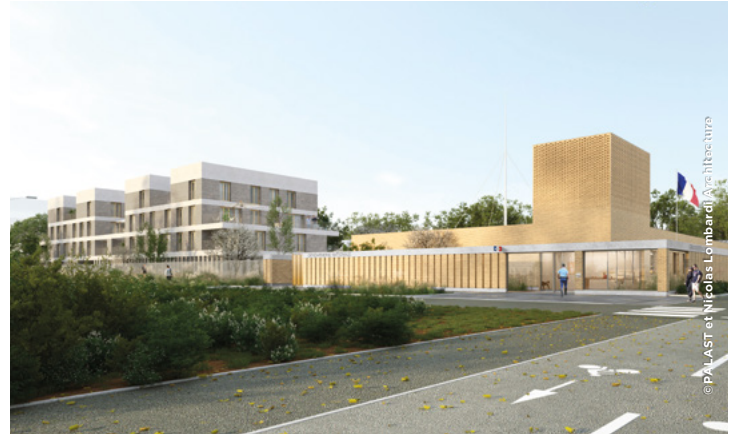
Gendarmerie de Moulon