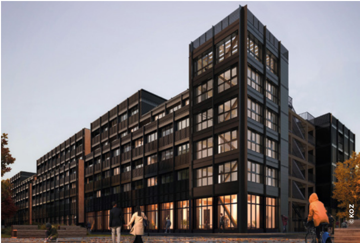
Résidence étudiante EE2 (312 lits privés)