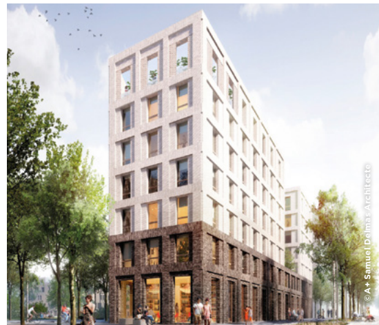
Résidence Maison des ingénieurs agronomes de 136 lits étudiants privés