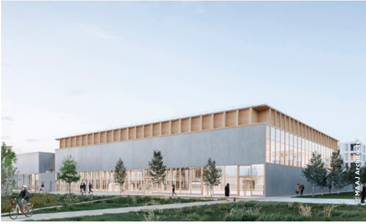
Complexe sportif universitaire de Corbeville