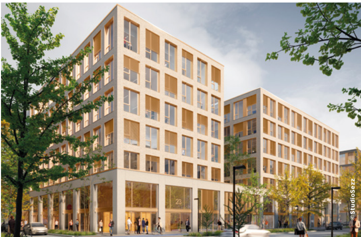
Le Next - Restaurant universitaire et bureaux