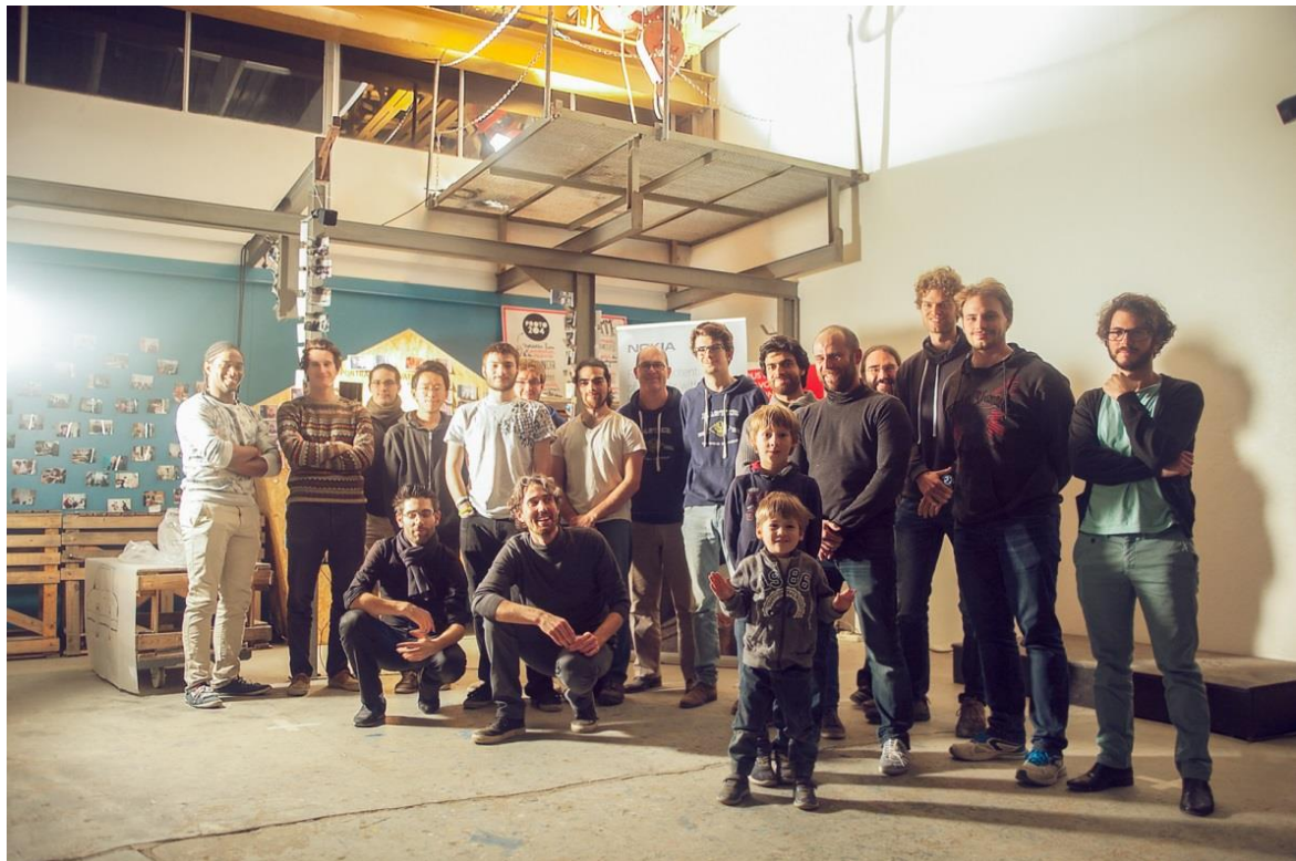
Les participants au hackathon Urban Moves au PROTO204.