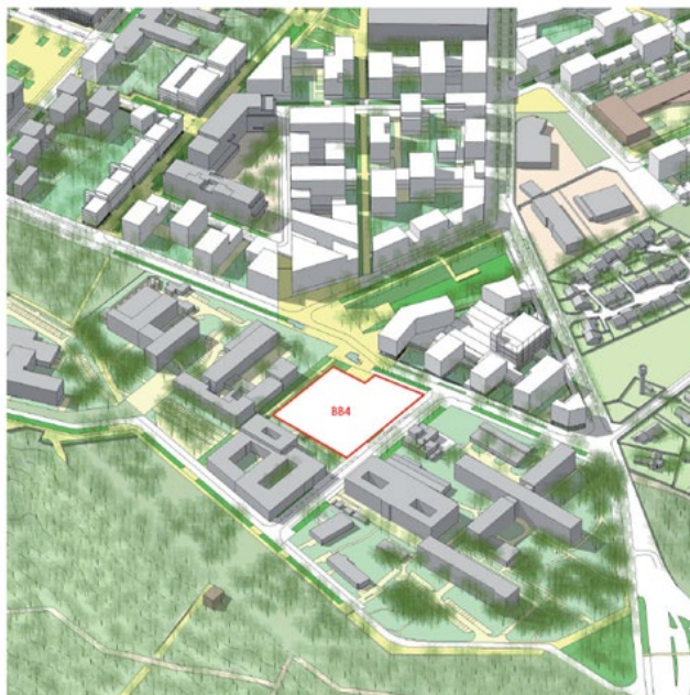
Situation du lot BB4 au sein du quartier de Moulon

L'ensemble du programme sera géré par le CROUS de l'Académie de Versailles et devra être livré pour la rentrée universitaire de septembre 2025.