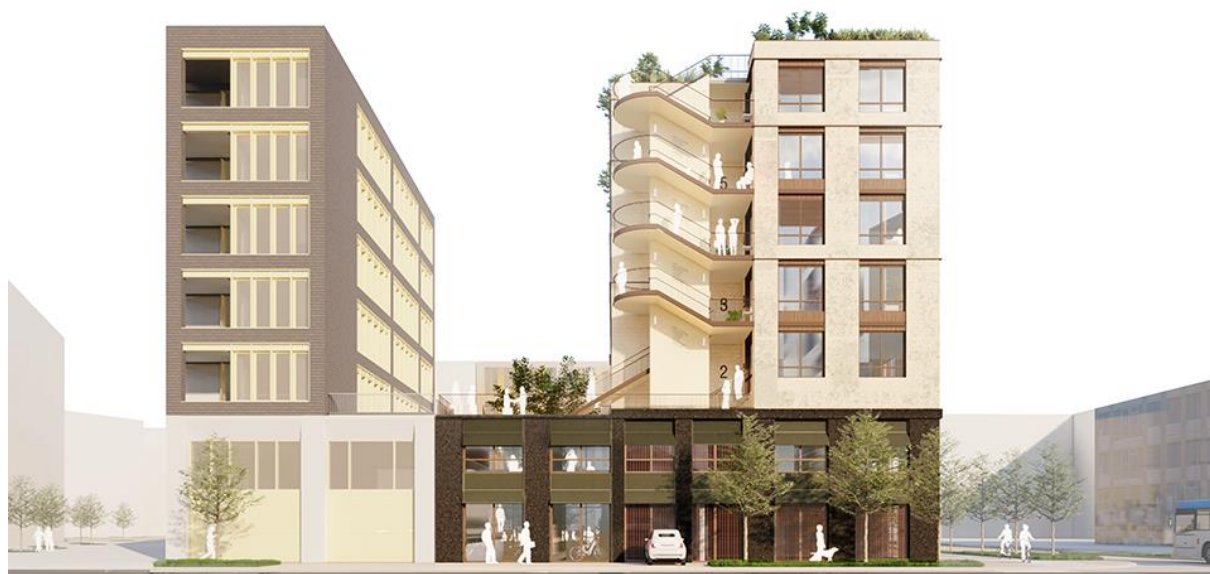
Les circulations en extérieur, créatrices de rencontres entre les usagers

Situé au sein du quartier de l'Ecole polytechnique à proximité du Campus-Agro Paris-Saclay, de l'IPHE, (Incubateur-Pépinière-Hôtel d'entreprise) et de Nano-Innov notamment, ce programme mixte comprendra une résidence en coliving de 115 logements T1-T2, des bureaux et des espaces partagés pour un total d'environ 5000 m 2 SDP , pour une livraison prévue au début de l'année 2024.