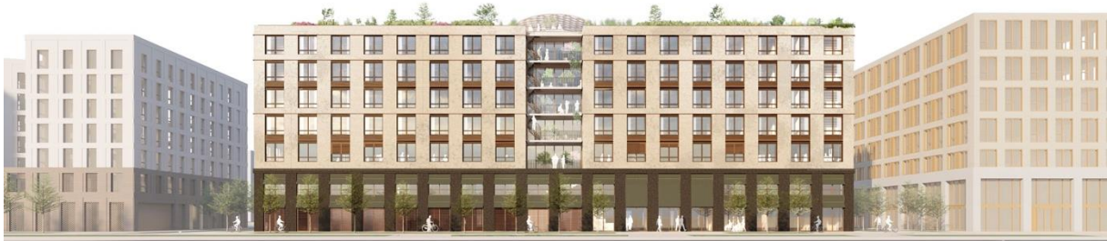
Façade Sud de la résidence