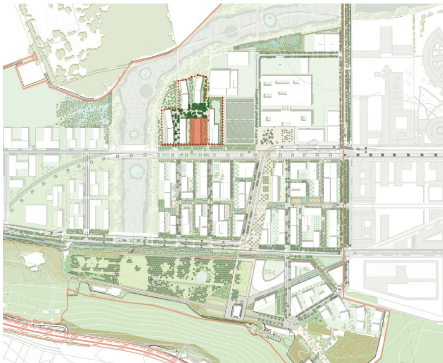
Situation du lot H4 au sein du quartier de Corbeville

La ZAC de Corbeville est un maillon stratégique du Campus urbain dont elle complète la programmation avec plus de 410 000 m 2 de surfaces de plancher constructibles et des équipements clés comme le futur hôpital Paris-Saclay, un complexe sportif universitaire, une caserne de pompiers ou un programme de recherche en imagerie médicale et nucléaire du CEA Paris-Saclay.