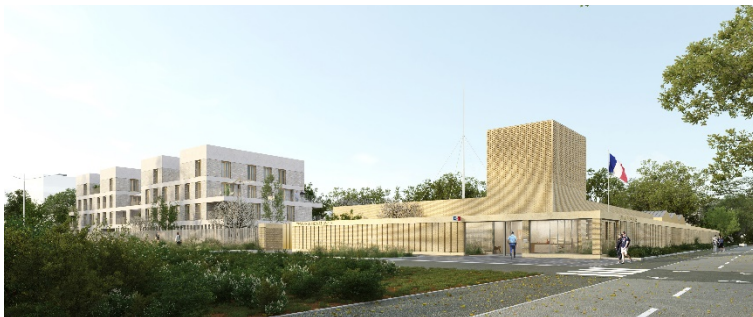
Caserne de gendarmerie de Moulon @Palast-Nicolas Lombardi Architecture

Composé d'une caserne et de 29 logements de fonction, cet équipement public sera situé au sein du quartier de Moulon, à Gif-sur-Yvette et bénéficiera d'une situation exceptionnelle d'entrée de Ville « Ouest » sur le plateau de Saclay