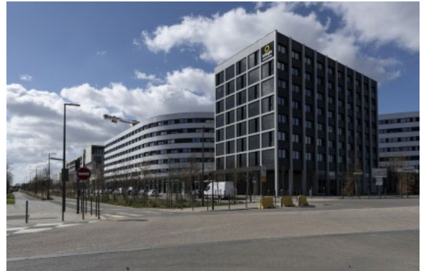
Résidences étudiante et hôtelière KLEY et commerces / XDGA