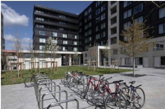
Résidence étudiante Jean d'Ormesson