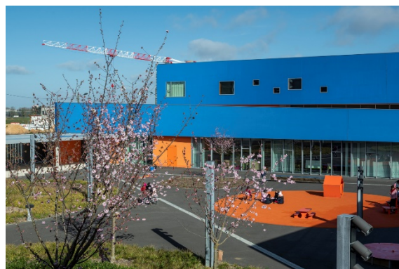
Groupe scolaire de Moulon / Dominique Coulon et Associés