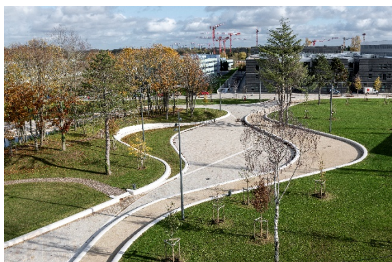
Parc de Moulon / West 8