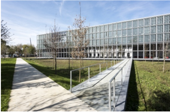
ENSAE ParisTech / CAB Architectes