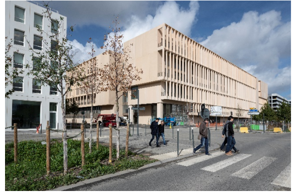
Institut Mines Télécom / Grafton Architects