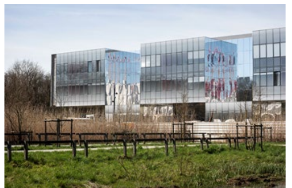
Le Centre de nanosciences et nanotechnologies / Michel Rémon