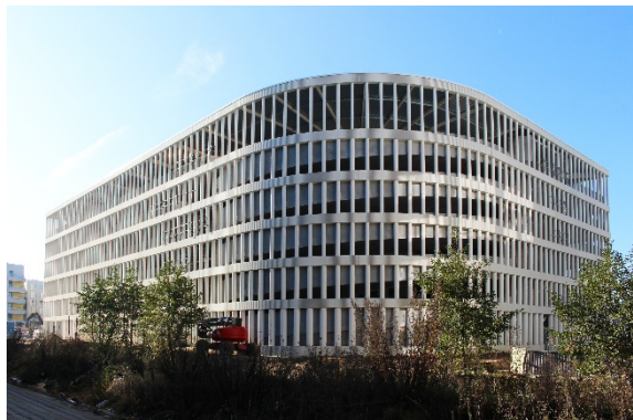
Parking Silo / GaP Architectes