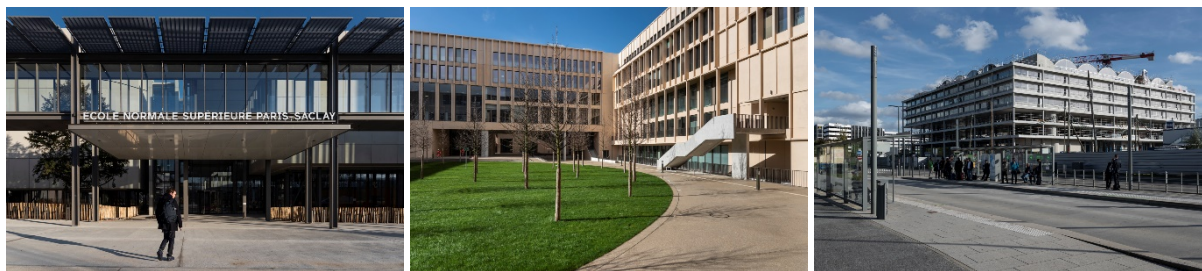
ENS Paris-Saclay / Renzo Piano - Télécom Paris / Grafton Architects - Résidence étudiante / Bruther&Baukunst

Renzo Piano, OMA, Grafton Architects, Muoto Architectes, Francis Soler, l'AUC, LAN & Clément Vergély, Bruther... l'Établissement public d'aménagement (EPA) Paris-Saclay propose au grand public de découvrir les bâtiments réalisés par les plus grands noms de l'architecture contemporaine, dans le cadre de balades urbaines organisées le samedi 17 octobre, à l'occasion des Journées nationales de l'architecture 2020.