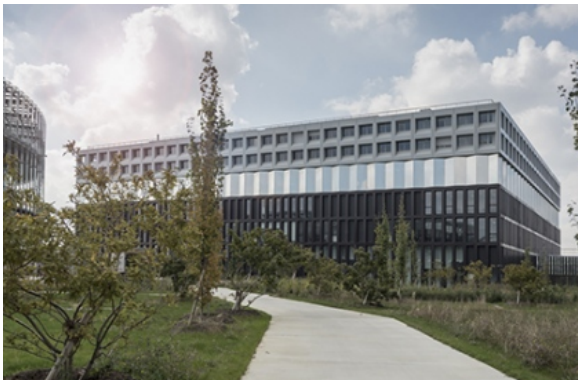
EDF Campus / Emmanuel Combarel Dominique Marrec architectes