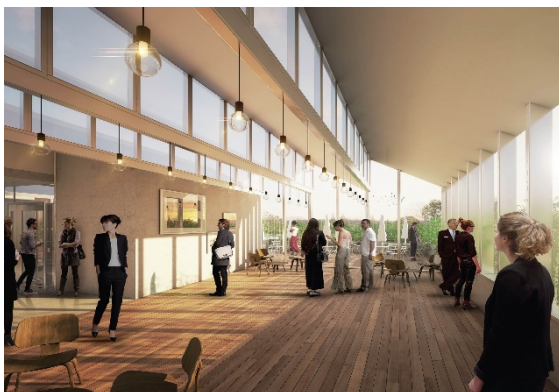
Vue du restaurant du 6 e étage © Think Tank Architecture

Sur une surface d'environ 6000 m 2 , le projet met l'accent sur une programmation ouverte à tous les usagers du Campus urbain basée sur le partage de connaissances (séances de brainstorming, conférences d'entrepreneurs, séminaires,...) mais aussi sur des espaces d'échanges et de vie réservés aux résidents de l'hôtel (cuisine commune, salon, salle de sport ; etc).