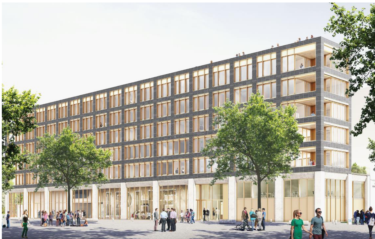
©Ignacio Prego Architectures | Perspective de l'Incubateur pépinière hôtel d'entreprises de Paris-Saclay

L'IPHE de Paris-Saclay (Incubateur pépinière hôtel d'entreprises) est un projet partenarial emblématique du territoire réalisé avec le soutien de nombreux partenaires publics : le Département de l'Essonne, la Région Ile-de-France, la Communauté d'agglomération Paris-Saclay, le Secrétariat général pour l'investissement (SGPI) dans le cadre du Programme des Investissements d'avenir et en partenariat avec l'Université Paris-Saclay et la ville de Palaiseau.