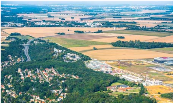
Vue aérienne du secteur de Corbeville

L'Établissement public d'aménagement Paris-Saclay lance une consultation de maîtrise d'œuvre pour la construction du complexe sportif de Corbeville de l'Université Paris-Saclay, maître d'ouvrage de l'opération. D'une surface utile couverte totale d'environ 7 000 m 2 , cette structure a pour ambition de répondre aux besoins en équipements sportifs générés par l'arrivée de nouveaux établissements d'enseignement supérieur et de recherche sur le Campus urbain Paris-Saclay.