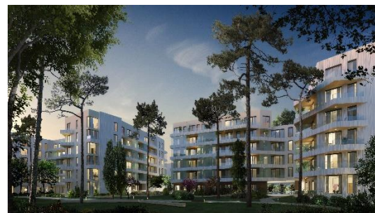
Lot A3 Crédit : Béal & Blanckaert et Atelier 115