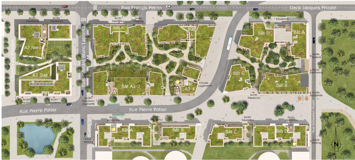
Perspective du programme O'izon