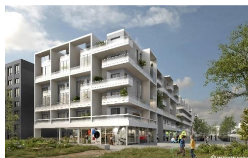
Vue du Lot A4 depuis le Parc de Moulon