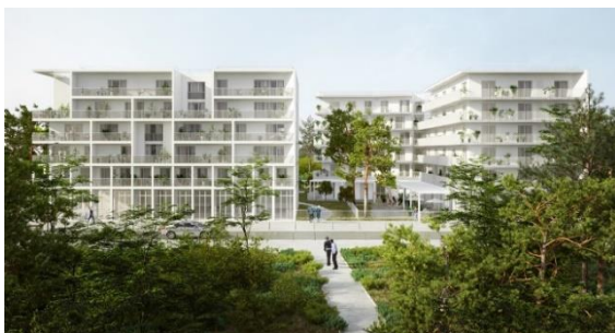
Lot A2 Crédit : Lambert Lenack