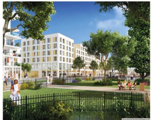
Lot A3 par Béal & Blanckaert et Atelier 115