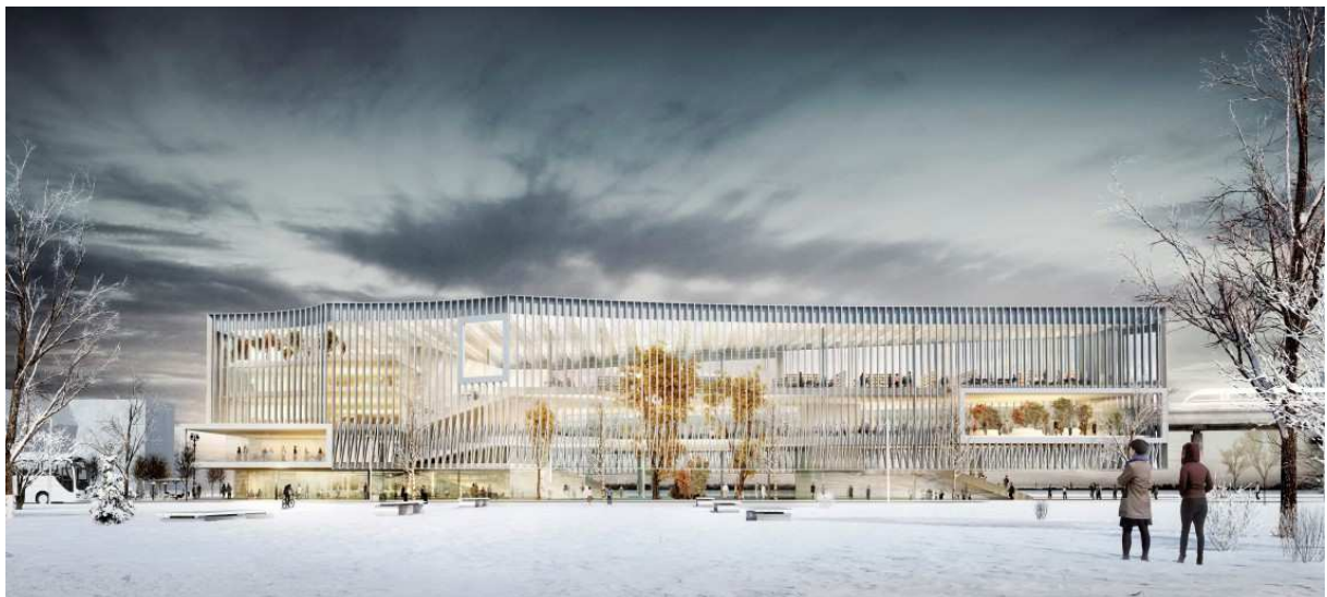
Perspective du Learning Center du campus Paris-Saclay - Crédit : Beaudouin Architectes et MGM Arquitectos

Un forum et un auditorium publics accueilleront des rencontres, expositions, démonstrations, colloques, débats et séminaires qui contribueront à la diffusion de l'esprit d'innovation qui caractérise Paris-Saclay. Une trentaine de salles de collaboration, un open space, un espace détente, une brasserie et un patio seront également accessibles à tous les étudiants, chercheurs et entrepreneurs.