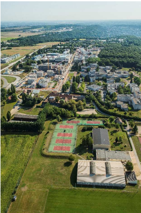
ZAC du quartier de Moulon

En octobre 2016, cinq équipes d'urbanistes avaient été présélectionnées, dans le cadre de cette consultation qui visait à désigner la nouvelle équipe de maîtrise d'œuvre urbaine de cette ZAC de plus de 300 hectares qui constitue l'un des principaux quartiers du campus urbain Paris-Saclay.