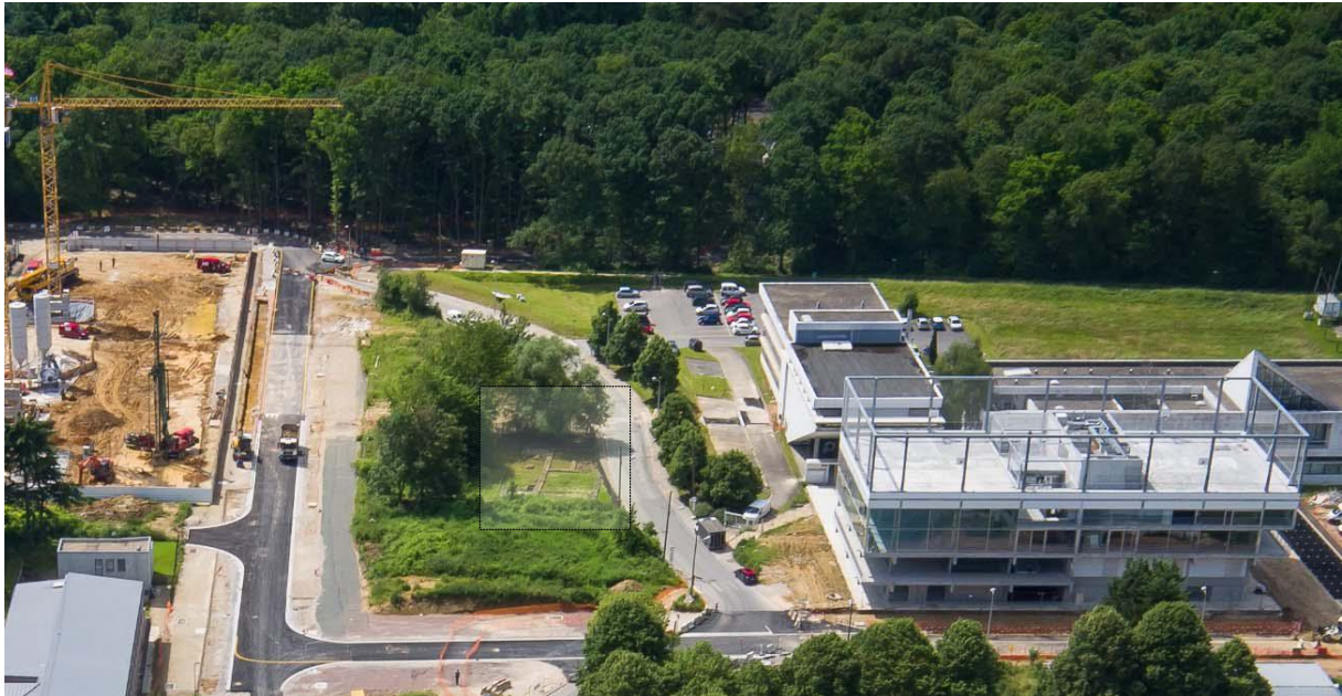
Périmètre de la Place du Lieu de Vie avec implantation prévisionnelle du mobilier, EPA Paris Saclay