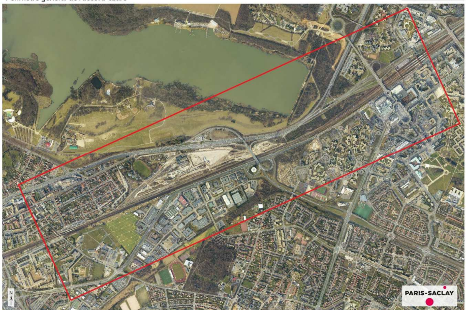
Périmètre général de l'accord-cadre

D'une surface initiale de 21 hectares, dont 18,7 hectares appartiennent à la SNCF, le site du projet urbain Freyssinet est appelé à devenir un pôle de développement intégré au Contrat de développement territorial des Yvelines, avec la création d'un quartier mêlant logements et développement économique . Il a pour objectif de s'intégrer au sein de l'agglomération, dans la continuité du centre-ville de Trappes et en lien avec les gares de Trappes et de Montigny-le-Bretonneux. Le périmètre et le programme précis du projet vont faire l'objet d'un important travail collaboratif entre l'EPA et les partenaires du projet.